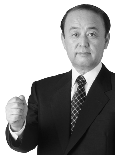
自由民主党 千葉県議会議員

この度これからの政治活動の参考にするため、アンケートを実施することにいたしました。“ちば”に住んでいてよかったと思えるまちづくりのために皆さんのご意見をお聞かせ下さい!! ご協力よろしくお願ひいたします。